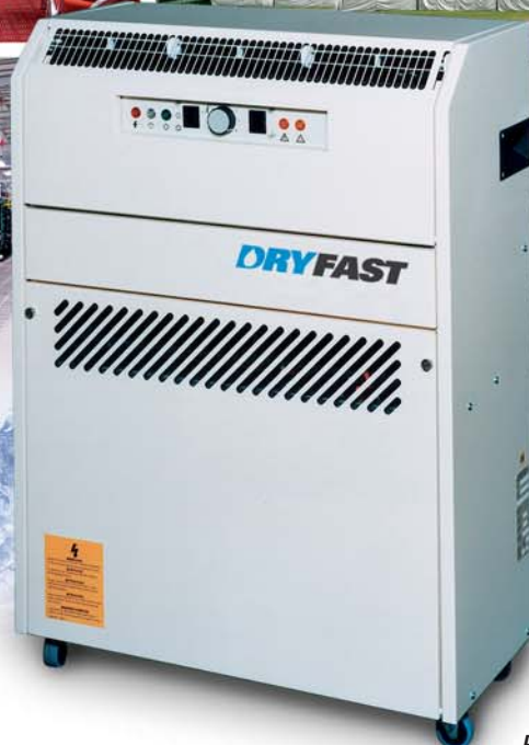
PT 4500 A