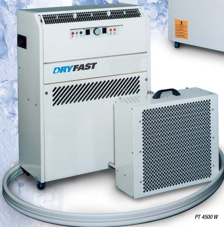
PT 4500 W